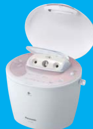
Panasonic スチーマー ナノケア EH-SA92-PN