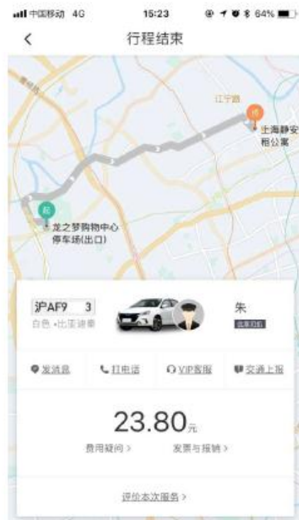
支払完了後の画面